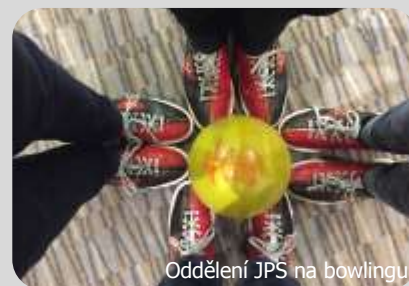
Oddělení JPS na bowlingu