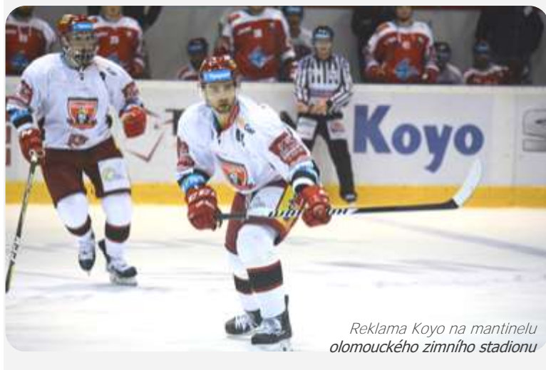
Reklama Koyo na mantinelu olomouckého zimního stadionu