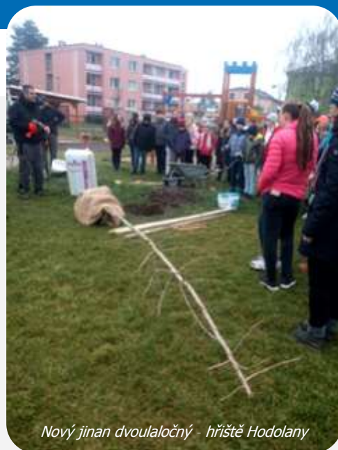
Nový jinan dvoulaločný - hřiště Hodolany