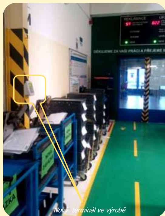
Nový terminál ve výrobě