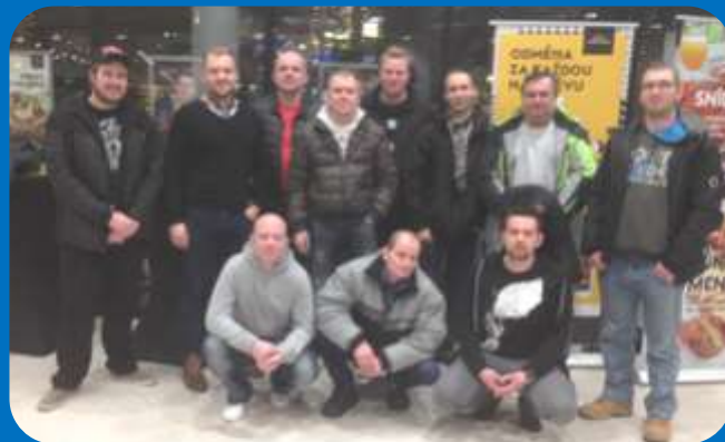
Kolegové ze skladu také vyrazili na bowling

Neváhejte a jděte si zahrát s kolegy BOWLING v galerii Šantovka - restaurace Lobster. Dle počtu hráčů můžete využít až 3 dráhy. Více informací na personálním oddělení.