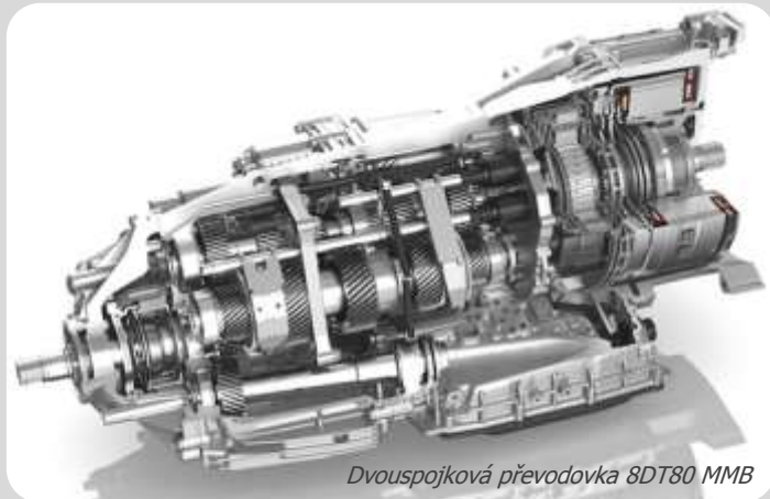
Dvouspojková převodovka 8DT80 MMB

Plánovaná linka bude produkovat nový díl pro zákazníka ZF Brandenburg, v celkovém předpokládaném objemu 300 tisíc kusů ročně. Jedná se o vnější kroužek se dvěma čelíčky pro válečkové ložisko. Toto ložisko bude použito ve dvouspojkové převodovce 8DT80 MMB pro vůz Porsche 911.