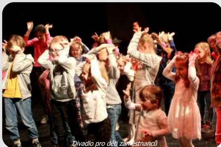
Divadlo pro děti zaměstnanců

V případě nejasností u jednotlivých benefitů, odměn nebo slev neváhejte kontaktovat personální oddělení.