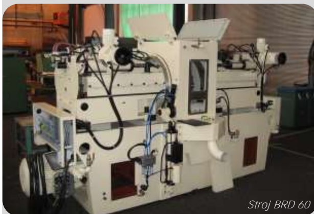
Stroj BRD 60

Tato změna rozmístění strojů je velice náročná, protože v této oblasti se již velmi těžko hledají volné prostory. V řešení bylo celkem 8 variant možného uspořádání. Nakonec byla vyhodnocena až osmá varianta jako nejlepší. A to jednak z pohledu finálního uspořádání oblasti, tak rovněž s ohledem na náklady spojené s těmito změnami.