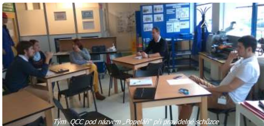
Tým QCC pod názvem „Popeláři“ při pravidelné schůzce

Oba týmy se v průběhu maximálně čtyř měsíců naučí používat hlavní filozofii kroužků kvality a tou je řešení problémů v osmi krocích. Součástí metody je i využívání nástrojů kvality, nástrojů