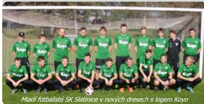
Mladí fotbalisté SK Slatinice v nových dresech s logem Koyo