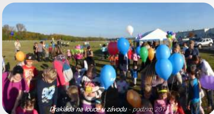
Drakiáda na louce u závodu - podzim 2017