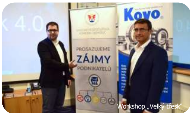
Workshop „Velký třesk“

V říjnu jsme ve spolupráci s poradenskou firmou CE-PA a Okresní hospodářskou komorou v Olomouci uspořádali v závodě workshop zaměřený na automatizaci, digitalizaci a průmysl 4.0 – „Velký třesk“ .