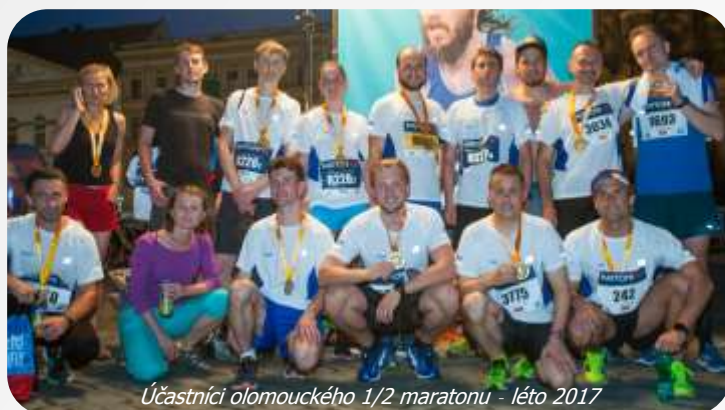
Účastníci olomouckého 1/2 maratonu - léto 2017