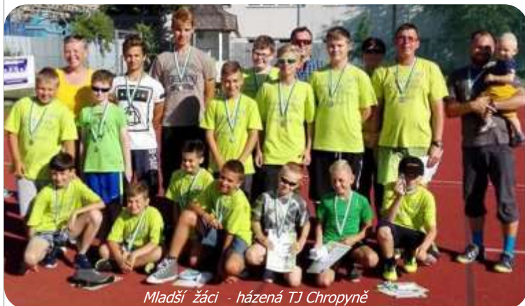
Mladší žáci - házená TJ Chropyně